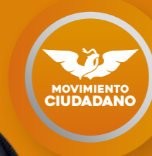
ALFREDO LOZOYA SANTILLÁN Diputado Federal

Encuesta realizada con rigor científico y estadístico, autoadministrada y aplicada con formularios directos vía telefónica. Grupo Objetivo: Ciudadanos del Estado de Chihuahua, hombres y mujeres, mayores de 18 años de todos los niveles socioeconómicos y de todas las regiones que conforman el Estado. Muestra: Se levantó una muestra representativa con 1,000 ciudadanos del Estado de Chihuahua, asumiendo muestreo aleatorio simple con población infinita, el margen de error se ubica en el +/- 3.8% bajo supuesto de varianza máxima y se determina en un $ 95% de confianza. Fecha de Levantamiento. Las encuestas fueron aplicadas entre los días 10 y 13 del mes de Enero 2025. @Derechos reservados DEMOSCOPIA DIGITAL. Se autoriza su reproducción al hacer referencia al autor, Facebook/DemoscopiaDigital, Whatsapp 56 5094 2400 · www.demoscopiadigital.com