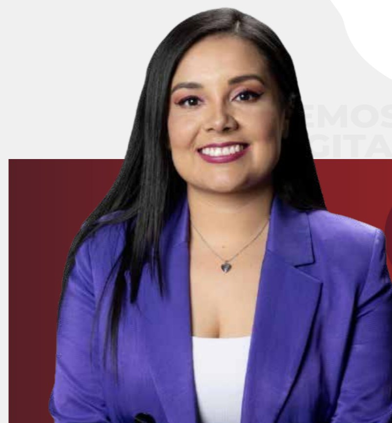
ANDREA CHÁVEZ TREVÍÑO Senadora de la República