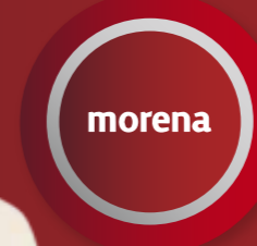
ROSI BAYARDO CABRERA Alcaldesa de Manzanillo