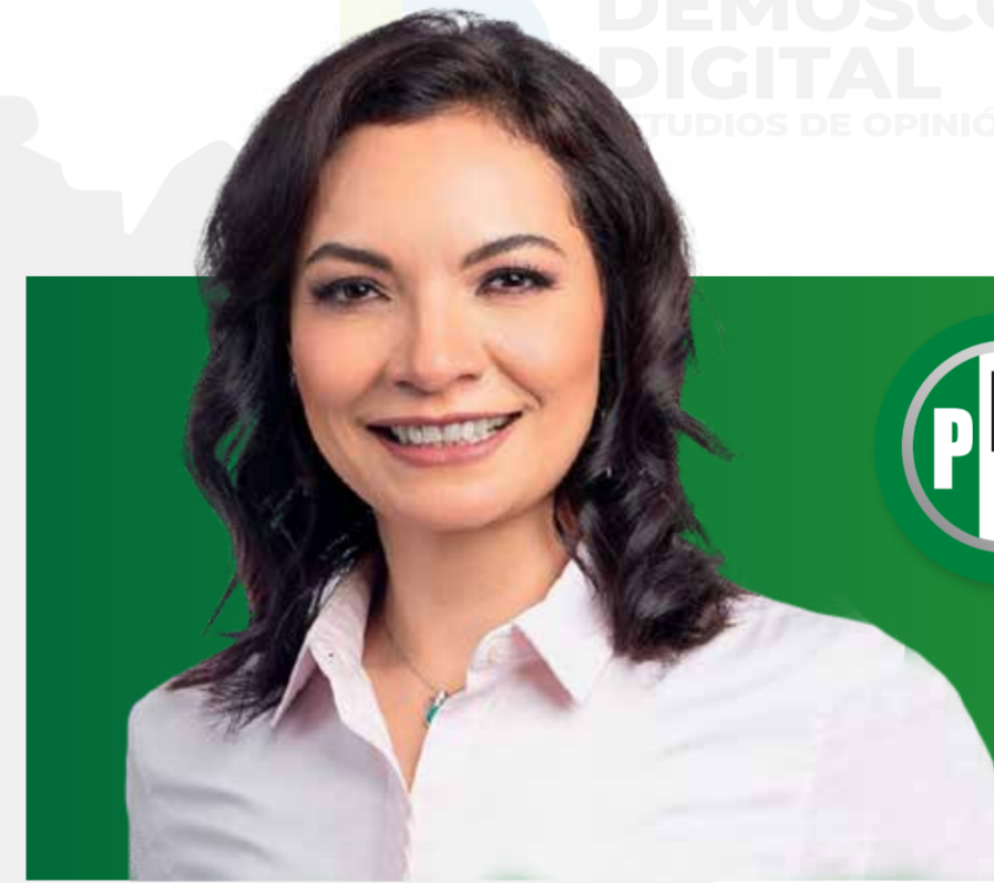
MELY ROMERO CELIS Senadora de la República