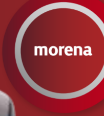
TOÑO IXTLÁHUAC Alcalde de Zitácuaro